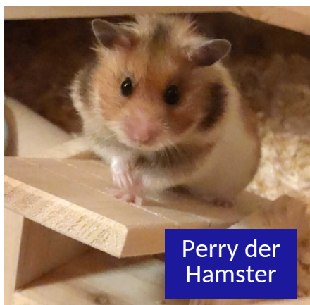
Perry der Hamster

- KloKurier-Frühstück - So. 16.04. - 11:00 Uhr Geb. 15b