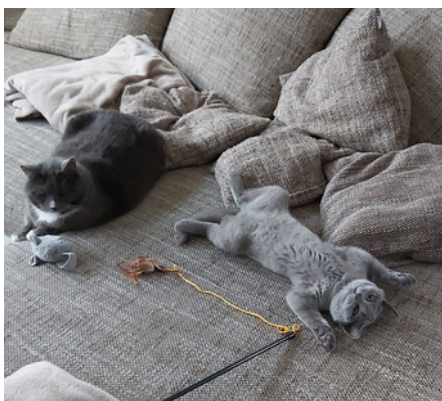
Das sind Lotti und Paddy

- TVStud Lübeck - Do. 07.04. - 17:00 Uhr Do. 21.04. - 17:00 Uhr Raum 15b-0.09